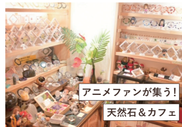
アニメファンが集う! 天然石&カフェ