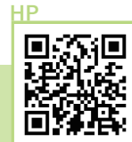
豊郷駅から徒歩1分

豊郷駅の目の前にあるお店。アニメグッズの展示、天然石・ペレットストーブの販売に加え、昼間はカフェを営業。