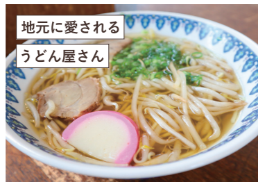
地元で愛される うどん屋さん