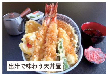
出汁で味わう天井屋