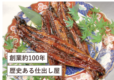
創業約100年 歴史ある仕出し屋