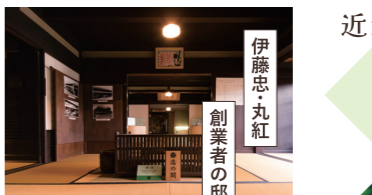
伊藤忠・丸紅 創業者の邸宅