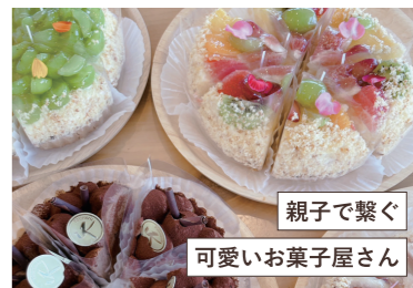
親子で繋ぐ 可愛いお菓子屋さん