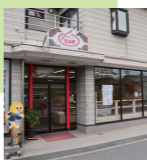
豊郷駅から徒歩1分

豊郷駅前にある昔ながらのパン屋さん。リーズナブルなお値段で、地元住民からも長く愛されています。