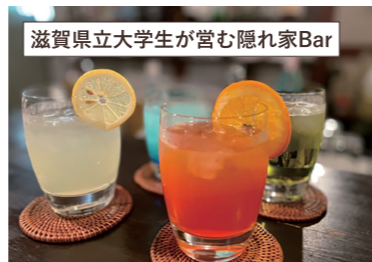
滋賀県立大学生が営む隠れ家Bar