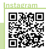
豊郷駅から徒歩16分

和菓子屋から始まり創業約100年。現在は洋菓子・パン屋さんとしても営業。地元産の果物を使ったスイーツがおすすめ。