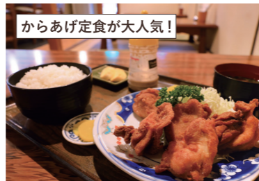
からあげ定食が大人気!