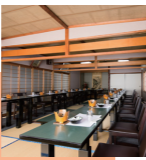
豊郷駅から徒歩7分

秘伝のたれで焼き上げたうなぎの蒲焼、ふわふわの自家製だし巻き卵が自慢。豊郷町のふるさと納税にも出品中! 団体利用OK