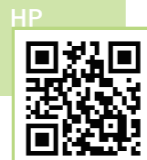
豊郷駅から徒歩20分

彦根藩主井伊家に命じられ創業。昔ながらの手法を受け継ぎ醸す「金亀」がおすすめ。事前予約で酒蔵見学も可能です。