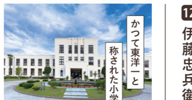
かつて東洋一と 称された小学校

石畑518 9:00-17:00 月曜日 (祝日の場合は翌日) 0749-35-3737