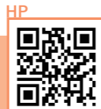
豊郷駅から徒歩10分

動物や植物に囲まれた、おしゃれな古民家カフェ。美味しいプレートランチやスイーツが味わえます。テイクアウトもOK◎