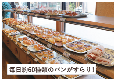
毎日約60種類のパンがずらり!