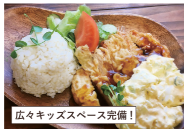
広々キッズスペース完備!