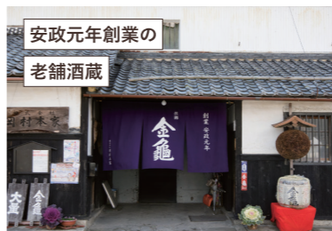
安政元年創業の 老舗酒蔵